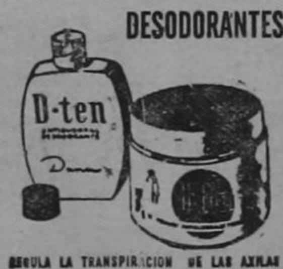
REGULA LA TRANSPIRACION DE LAS AXILAS Y LAS DESODORIZA POR VARIOS DIAS.